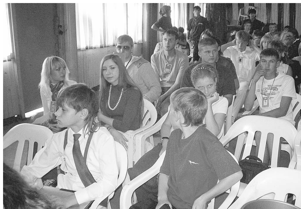
В ожидании мэтров.